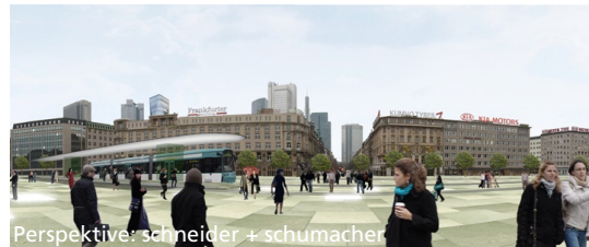
Perspektive: schneider + schumacher

in Arbeitsgemeinschaft mit schneider + schumacher, Frankfurt am Main BPR Beraten Planen Realisieren, Darmstadt